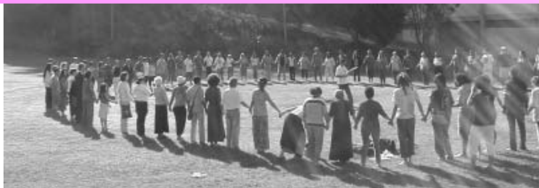
Encontro Nacional dos Grupos de Trocas Solidárias, realizado em Mendes