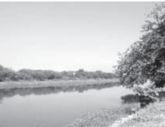
De um lado, a natureza insiste o seu espaço na paisagem...