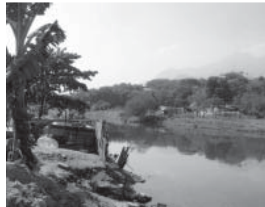
... do outro, o descaso da Prefeitura grita a sua presença.

Saio agradecendo-a pela entrevista com um abraço de apoio e o desejo da melhor conquista na busca que foi travada por aquela Comunidade, e volto a subir e descer a Serra de Jacarepaguá, retornando para o centro da cidade. Desta vez, já nem olho mais para os lados na tentativa de enxergar os limites da cidade olímpica. Penso somente no valor infinito que o ensaio sobre a invasão e a expulsão promovido pelos Jogos Pan-americanos de 2007 contribuiu para que crescesse como aprendizagem de vida e luta naquele pessoal, mesmo sem a mínima intenção.