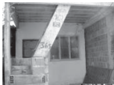
Os números de demarcação pintados sem permissão nas casas atestam o tratamento arrogante e invasor da Prefeitura dado às famílias.