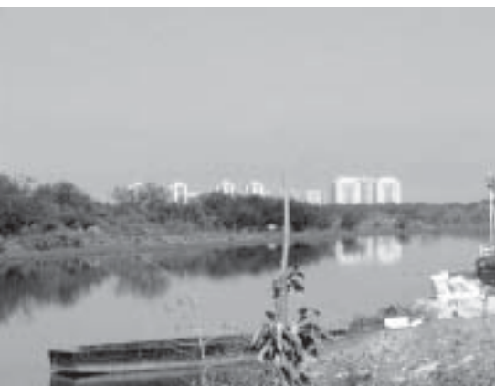
Entre a Barra da Tijuca e o Canal do Anil, o horizonte que os separa de suas realidades.

Será que a Vila do Pan não está dentro de uma área de risco, se for partir do princípio que a gente ocupou uma área de risco?